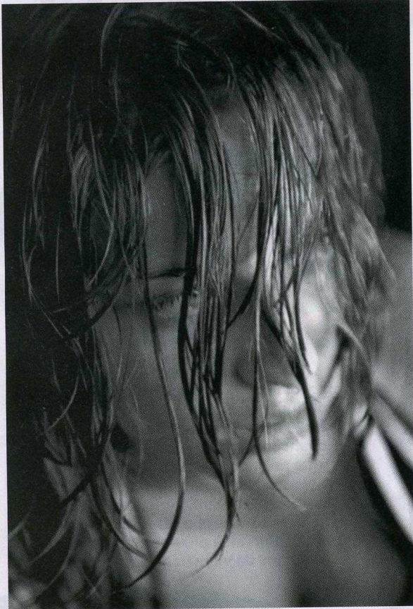
△ 1° Classificata. Espressione di donna di Marco Facincani , Villafranca di Verona