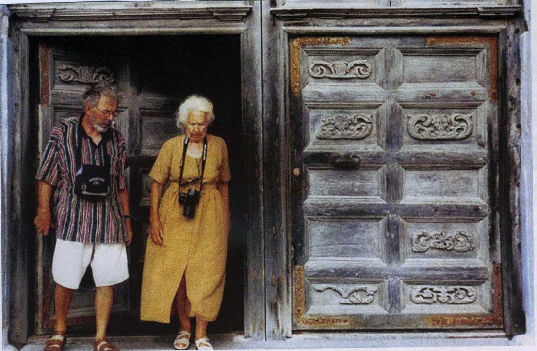
△ 1° Classificato. Turisti a Cefalò di Bruno Adamo , Palermo