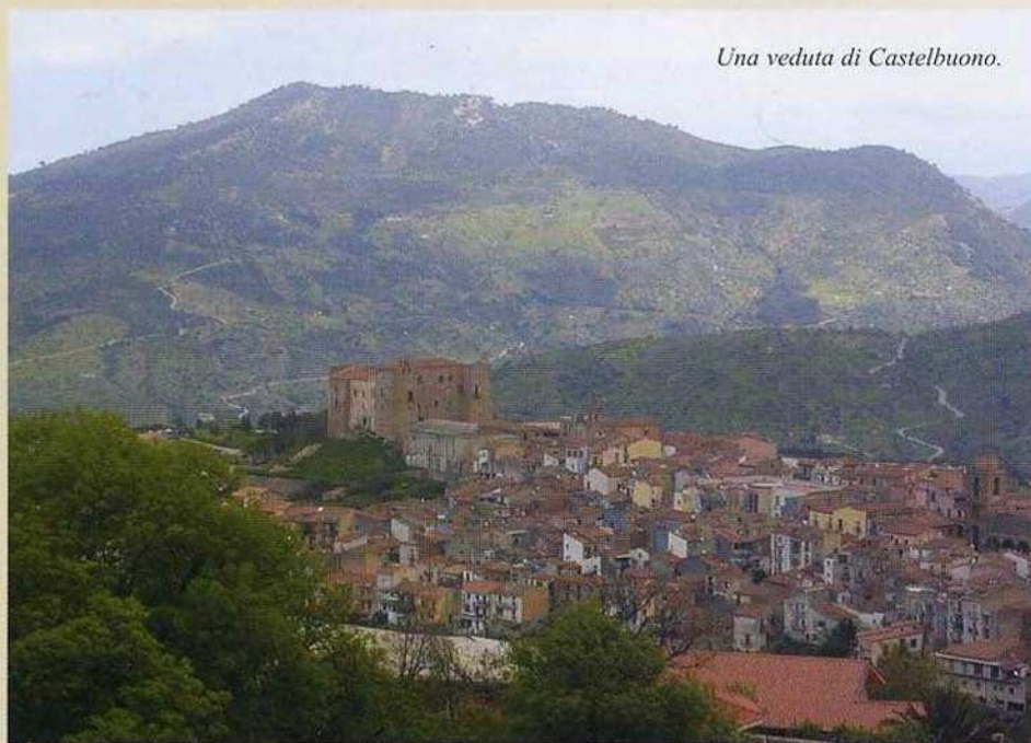
Una veduta di Castelbuono.