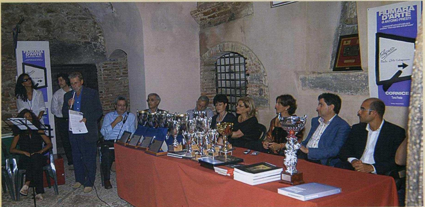
Autorità e Giuria in un momento della premiazione.

Anche quest'anno a Castelbuono si è svolto il "2° Concorso Nazionale di Fotografia" - Città di Castelbuono - Premio Speciale Giovani "Enzo La Grua", indetto dall'Associazione Culturale "Gruppo T", la cui iniziativa nasce per commemorare la figura di "Enzo La Grua", già ferroviere (capo della Stazione ferroviaria di Castelbuono) e socio di questa Ass. D.L.F., affermato pittore ed attore che, proprio sulla scena di uno spettacolo teatrale a Gangi, ha fatalmente cessato di vivere.